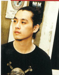
设计师上官喆本次的特别创作充满新鲜感,大胆尝试了针织T恤的多层拼接,用棉布的质地制造出如同镶满铆钉的皮衣效果,打破了材质的限制,富有想象力。