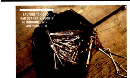
SAUTOIR "CHIODO" PAR OSANNA VISCONTI DI MODRONE. VENDU SUR YOOX.COM.