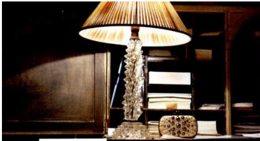
DANS SA CHAMBRE UNE LAMPE-OBJET ET UNE MINAUDIÈRE CLOUTÉE BOTTEGA VENETA.