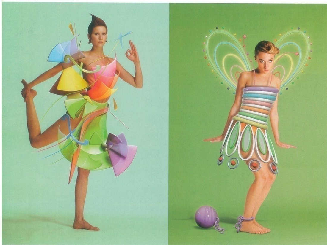
Le Yooxcover di aprile 2004 e gennaio 2006. Cliccando sulle immagini della homepage la figura si anima e cambia forma e colore, accompagnata dalla musica.