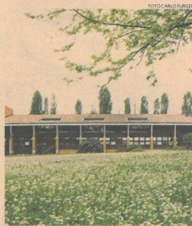
► In alto, Livia Firth ritratta per Yooxygen. Sopra, gli headquarter di Zola Predosa, in provincia di Bologna. Sotto, la sezione Yooxygen, dedicata alla vendita di abiti e accessori eco-sostenibili

Nel 2012 Yooxygen ha gestito 117 marchi registrando una crescita di fatturato rispetto all'anno precedente; Italia, Usa, Germania, Russia e Francia sono state le aree geografiche nelle quali l'e-commerce di Yoox ha segnato le performance migliori. A confermare questo successo è il numero di stock-keeping unit gestite nel 2012: 1.300, in crescita del 63% rispetto all'anno precedente. Yooxygen è stato accolto con favore anche da designer più e meno famosi - da Vivienne Westwood agli iou Project - che hanno realizzato prodotti e collezioni ad hoc per il sito. Una presenza abituale è ormai anche quella di Livia Firth e della sua linea Eco-Age, pensata per offrire alle donne di tutto il mondo un guardaroba chic e sostenibile allo stesso tempo.