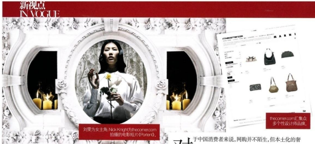
刘雯为女主角, Nick Knight为thecorner.com拍摄的电影短片《Portrait》。

想象一下,在家中打开电脑,就能随时选购最新的高级时装、小众品牌及独立设计师系列,24小时不打烊。而你的货品将在第二天准时送达,随你试穿搭配,喜欢的留下,不喜欢的也可以退回。这样的购物方式,听起来就让人兴奋不已。而事实上,随着Yoox集团正式登陆中国,这一切都变得触手可及。