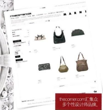
thecorner.com汇集众多个性设计师品牌。

Giselle 超模妈妈 8位T台 分享常 泰莉亚·科 30岁真 前港姐李 40岁开 达美妮·塞 80岁名