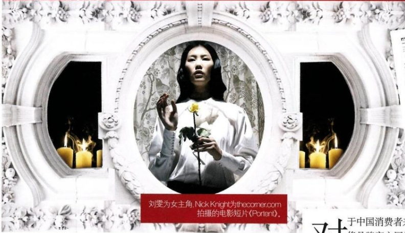
刘雯为女主角, Nick Knight为thecorner.com拍摄的电影短片《Portent》。