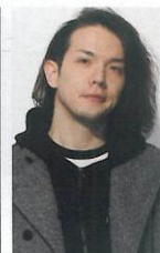
斯巴达乐队主唱博西