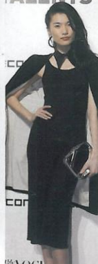
身穿王汁和歌敬捷秋冬系列的超模李丹妮