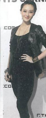
身穿邹游作品的明星林鹏